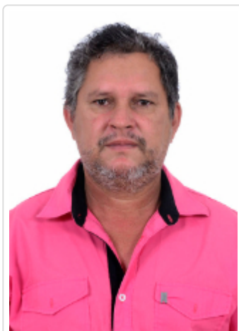
Foto para urna